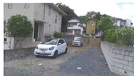
図面が現況と異なる場合、現況優先とさせていただきます